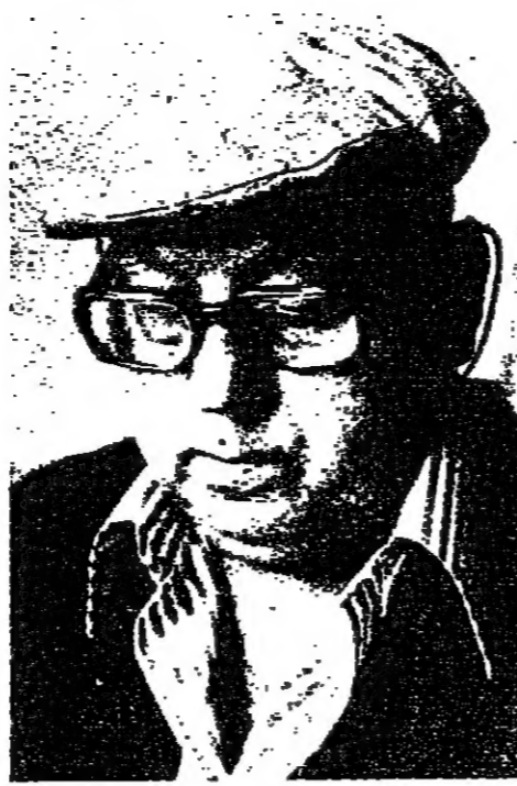
اياس متى : لغة التواصل